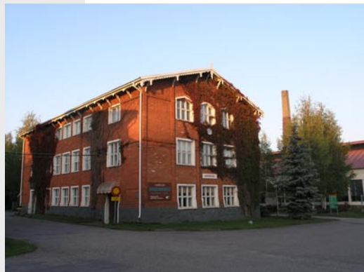
"Kivimuuri"-rakennus sijaitsee keskeisellä paikalla Nuutajärven kylässä